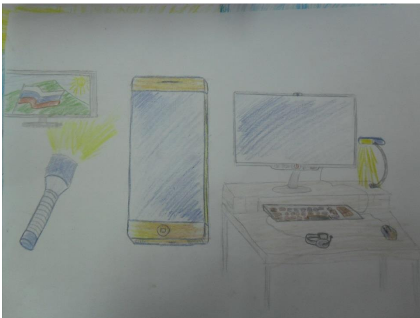
3 место-Тарасов Родион